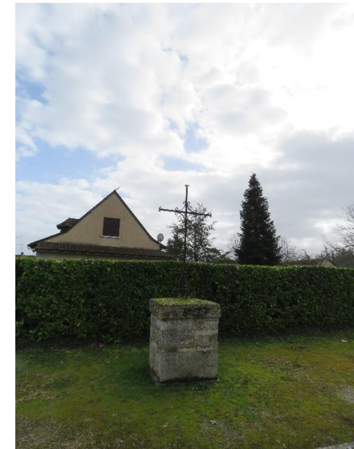
Croix à Saint-Martial-d'Artenset