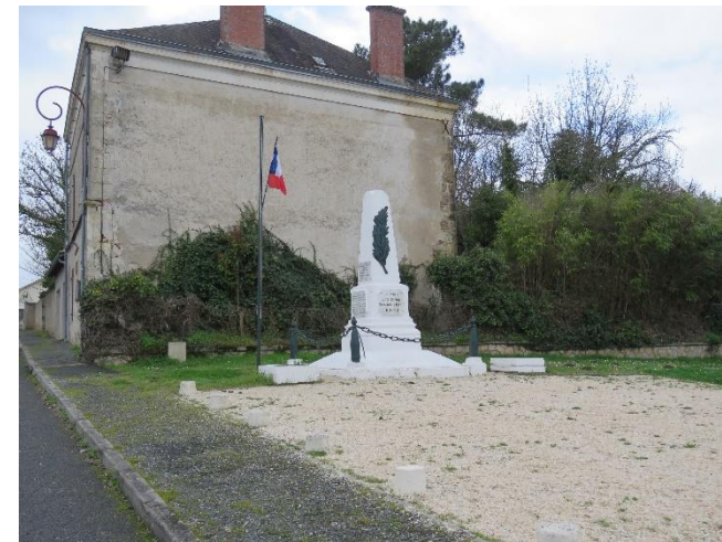
Monuments aux morts à Beaupouyet

Il existe quelques sites remarquables faisant partie du patrimoine local au sein des aires d'études paysagères. Il s'agit notamment d'églises, de croix et calvaires ainsi que de monuments aux morts ponctuant le paysage.