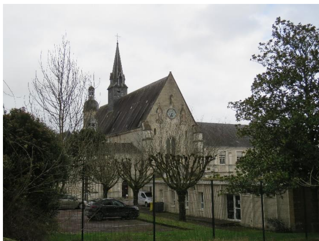
Chartreuse de Vauclaire