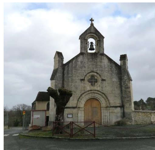
Église à Beaupouyet